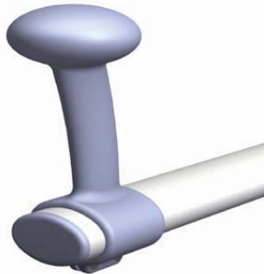
transferknop voor op de toiletsteun