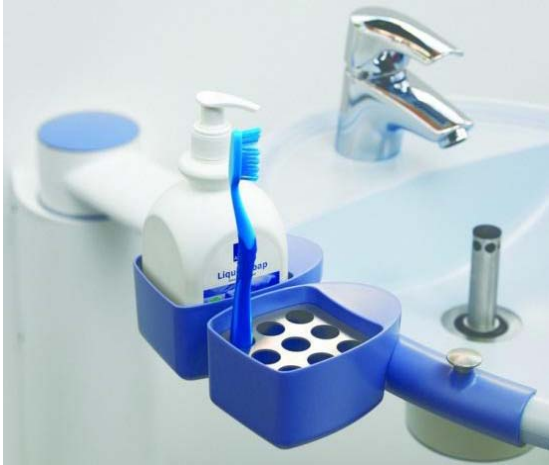
Accessoires als zeep- en tandenborstelhouder